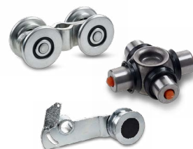
Exempel på kundanpassade produkter.

Produkter i varje leverans kvalitetskontrolleras enligt IQL (Ibec quality level), en variant av AQL. I vårt kontrollsystem testar vi större kvantiteter än AQL kräver.