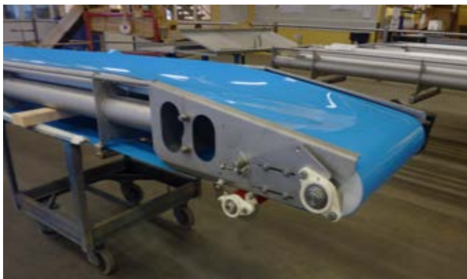
Transportband för livsmedelsindustri.