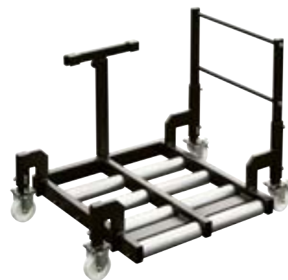
Vagn för batteribyten, i rullarna sitter Internordics rullgavellager.

Tillsammans med ytterligare en entreprenör gör JOPRO en spännande satsning i Asien där man bildat ett JOPRO Asia med placering i Thailand. Här kommer produktionen att ske för den asiatiska marknaden.